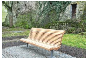
Spendenprojekt ‚Bürgerbänke für Backnang‘