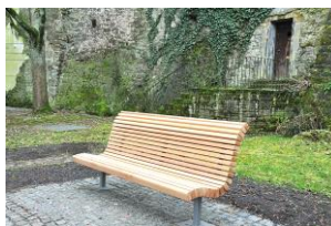
Spendenprojekt ‚Bürgerbänke für Backnang‘