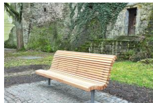
Spendenprojekt ‚Bürgerbänke für Backnang‘